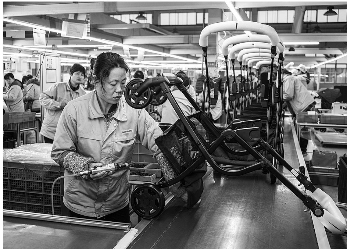
河北省平乡县是全国最大的自行车零配件及儿童自行车产业基地。今年以来,农行平乡县支行以该县自行车产业集群为着力点,主动降低贷款利率,减轻企业融资成本,切实支持民营企业发展。截至目前,该行各项贷款余额7.06亿元,比年初纯增2.23亿元,增速高达46%。图为该行支持的好孩子儿童用品公司北方生产基地生产车间一角。

此外,渤海银行还在《实施意见》中提出,将通过底层技术创新,改进流程,优化体验,加强线上线下联动,降低运营成本;研究制定专项绩效考核制度以及差异化的考核指标体系,建立健全对民营企业授信业务的尽职免责和容错纠错机制。